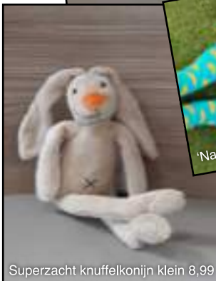
Superzacht knuffelkonijn klein 8,99