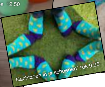
'Nachtzoen in je schoenen' sok 9,95

Wij geven u graag een kijkje in de etalage van het Ronald McDonald Huis. Met de aankoop van elk van deze artikelen helpt u ons ervoor te zorgen dat ouders van ernstig zieke kinderen altijd op loopafstand van het ziekenhuis kunnen verblijven, ook tijdens de feestdagen!