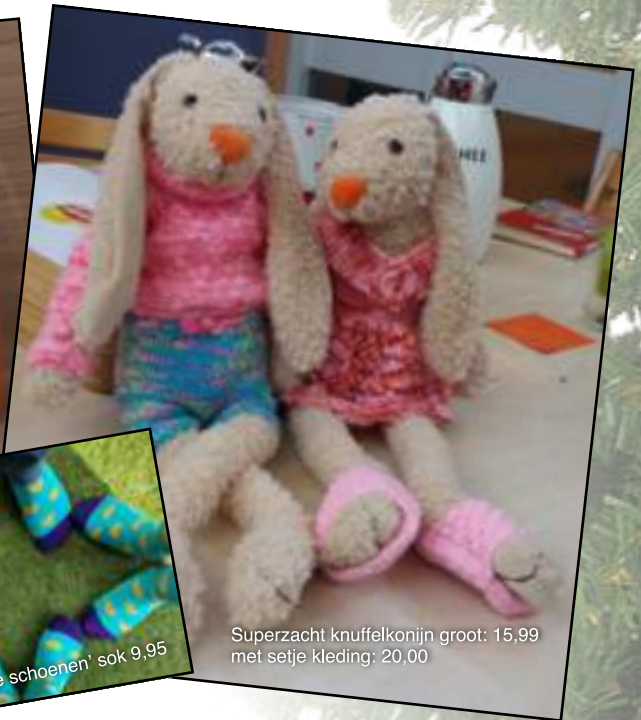
Superzacht knuffelkonijn groot: 15,99 met setje kleding: 20,00