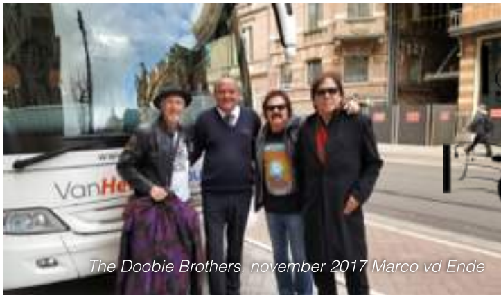
The Doobie Brothers, november 2017

The Doobie Brothers is een Amerikaanse rockband afkomstig uit San Jose, California. De kern wordt gevormd door zanger-gitaristen Tom Johnston en Patrick Simmons. De band is vooral bekend van hun hits Long Train Running , What a fool believes en Listen to the music . De band heeft wereldwijd meer dan 40 miljoen albums verkocht. Je zal ze maar in je bus hebben gehad!