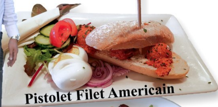
Pistolet Filet Americain