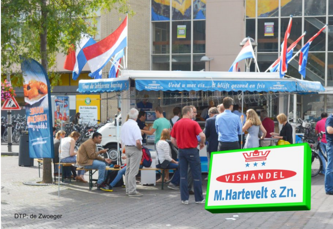
DTP: de Zwogger